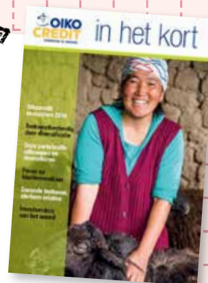
Jaarverslag 2016 Oikocredit Nederland

Van het jaarverslag van Oikocredit International over 2016 is een verkorte versie beschikbaar in het Nederlands. Met achtergrond-informatie over Oikocredits portefeuille, feiten en cijfers. Lees 'm nu op www.oikocredit.nl/publicaties