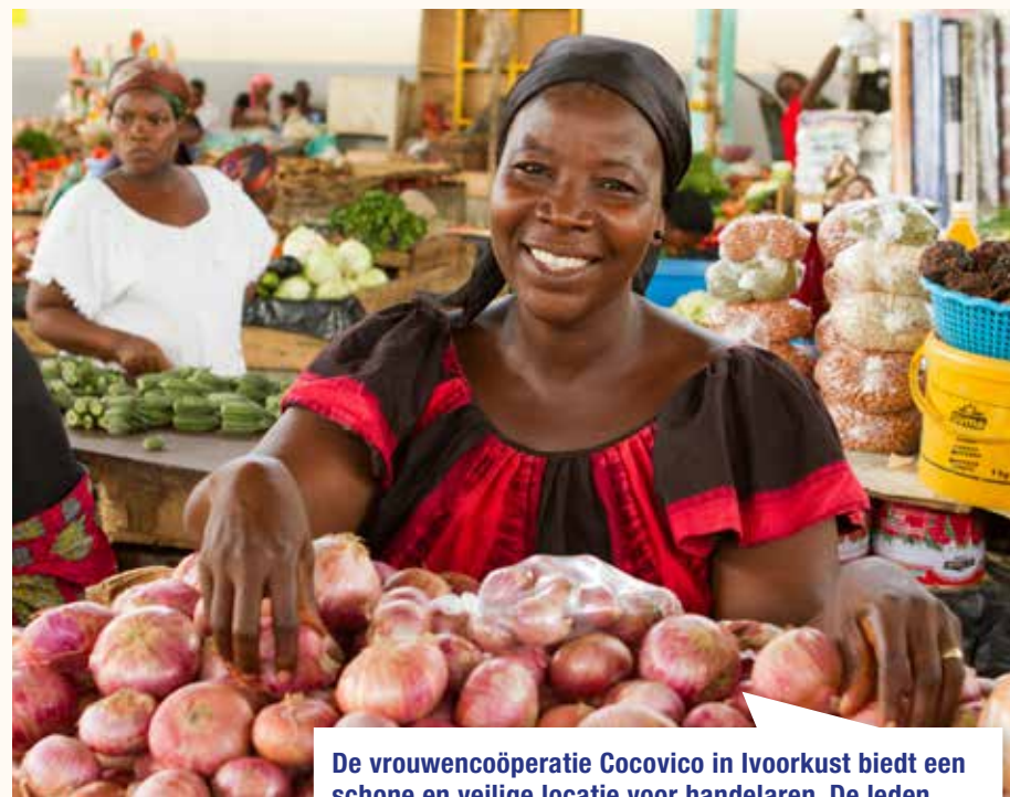
De vrouwencoöperatie Cocovico in Ivoorkust biedt een schone en veilige locatie voor handelaren. De leden verkopen hun waar op een grote overdekte markt. Deze markt, met plek voor duizend handelaren, werd mogelijk gemaakt door een lening van Oikocredit.

Van het resultaat over 2015 van € 828.624 wordt € 1.395.054 in overeenstemming met de bepaling van de gevers aan het bestemmingsfonds 'Duurzaam Belegd' toegevoegd. Het restant ten bedrage van € 566.430 betreft het negatieve saldo baten en lasten over 2015 en zal aan de algemene reserve onttrokken worden.